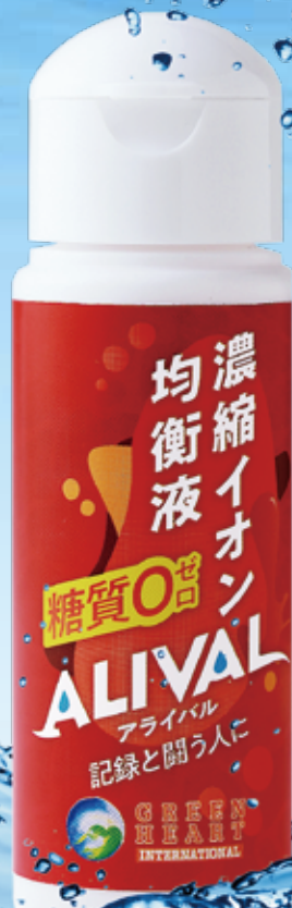
ALIVALウォーターと一般的な水分補給商品との成分比較